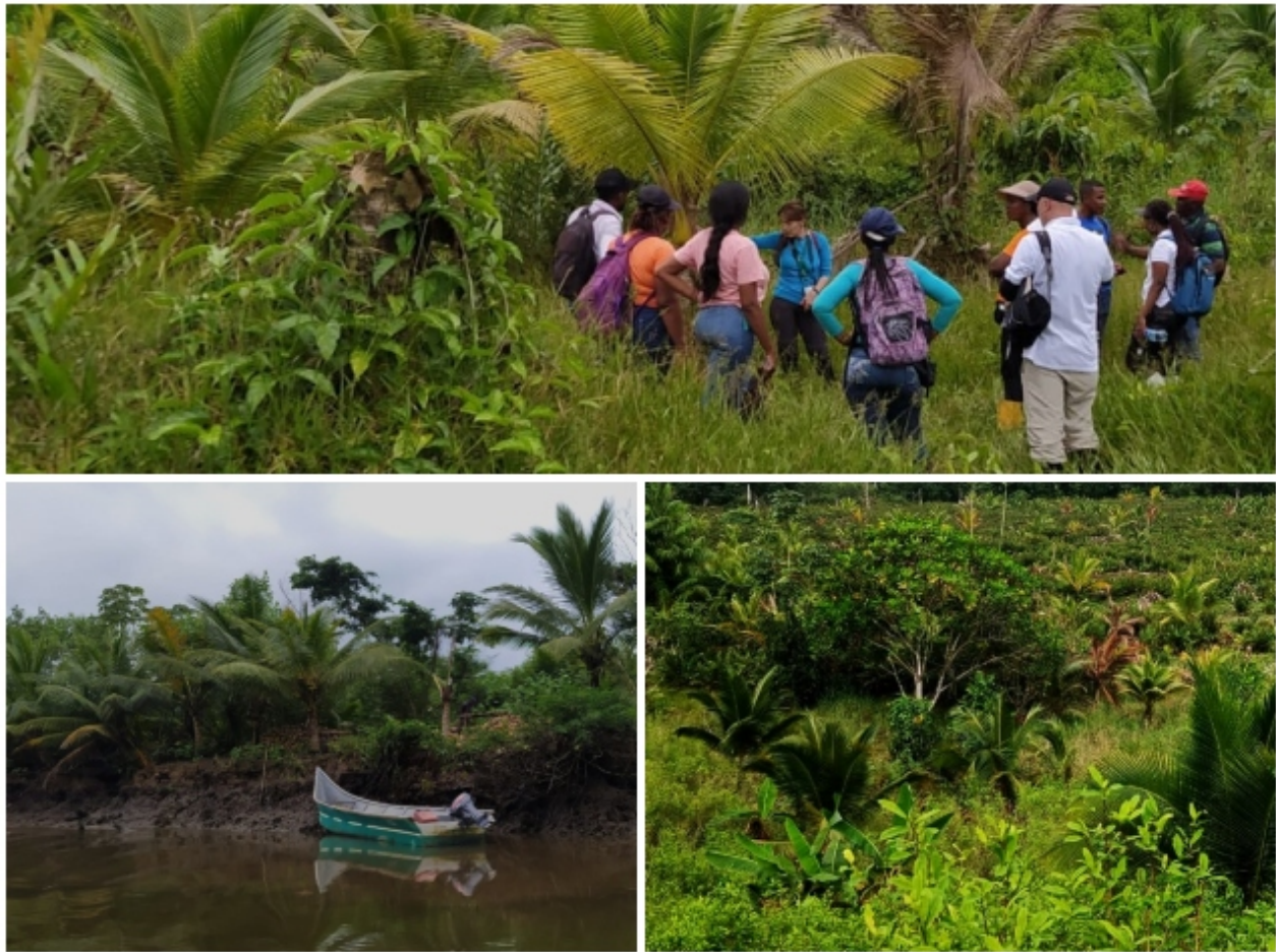
Cultivos de palma de coco.

Identificación de plagas, prevención, monitoreo e intervención: claves para la productividad agrícola En Nariño, el ICA le hace frente a las plagas que atacan la producción de coco