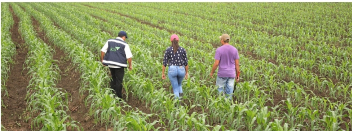
Predios de maíz.