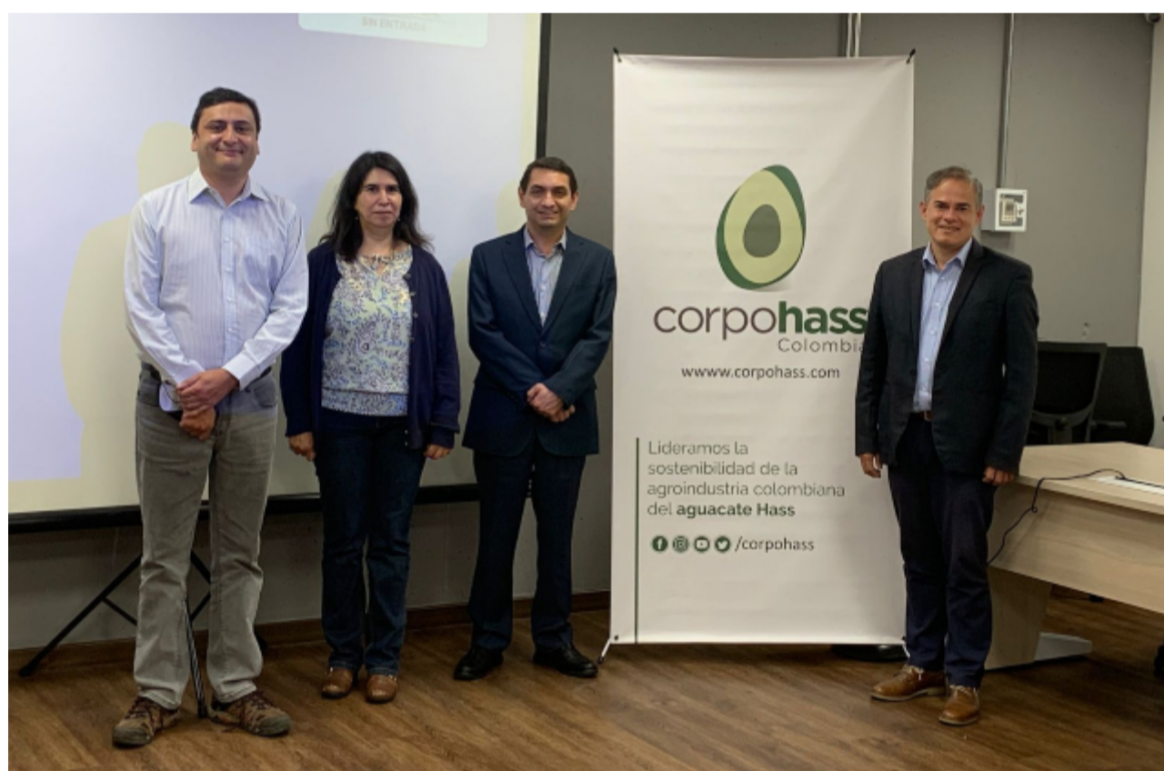
Aguacate Hass colombiano a un paso de conquistar el mercado chileno