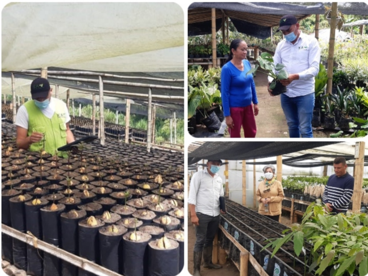
Inspección y control a viveros