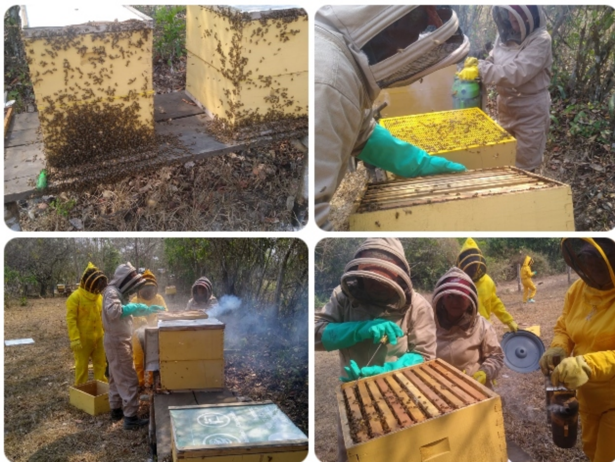
Visita a predios apícolas

Arauca, Arauca. 01 de abril del 2022. Con el fin de conocer las características de las explotaciones apícolas y proyectar acciones sanitarias y de inocuidad en la producción primaria de todos los productos derivados de la apicultura, el ICA realiza visitas de seguimiento a predios apícolas de Arauca.