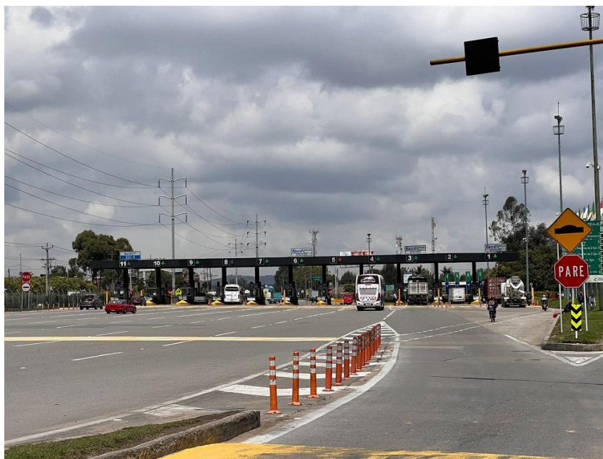
El Pico y Placa Regional organiza la entrada de viajeros por los nueve corredores de ingreso a Bogotá. En la imagen, el Peaje Concesión Calle 13