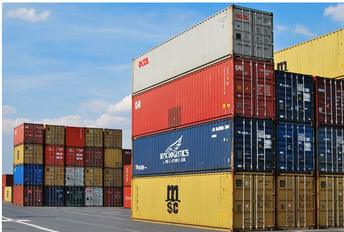
Fletes marítimos espantan, Analdex advierte inflación mundial