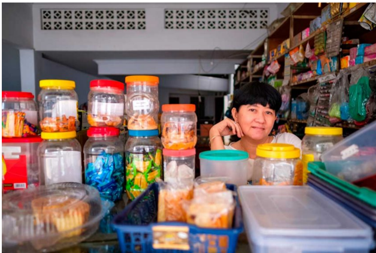
Pie de foto: los interesados en acceder a los servicios especializados para micronegocios, podrán ingresar en compralonuestro.co/micronegocios .

Para conmemorar el Día del Tendero, Compra Lo Nuestro invita a tenderos y micronegocios del país a acceder sin costo a compralonuestro.co/micronegocios , y recibir servicios para mejorar sus capacidades administrativas y financieras, acelerar su transformación digital y avanzar en comercio electrónico.