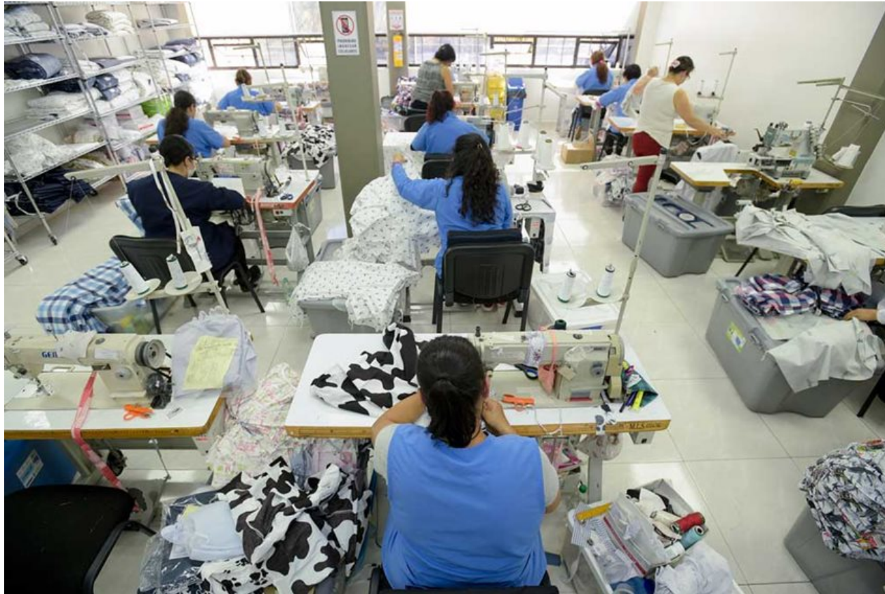
Pie de foto: la nueva normativa permite a la Dirección de Impuestos y Aduanas Nacionales - DIAN- realizar rebajas de sanciones, intereses y capital.

Los beneficios serán aplicados a las empresas afectadas por las causas que motivaron la declaratoria del Estado de Emergencia Económica, Social y Ecológica de que trata el Decreto 417 del 17 de marzo de 2020, siempre que se encuentren inmersos en el marco de procesos de insolvencia de naturaleza concursal.