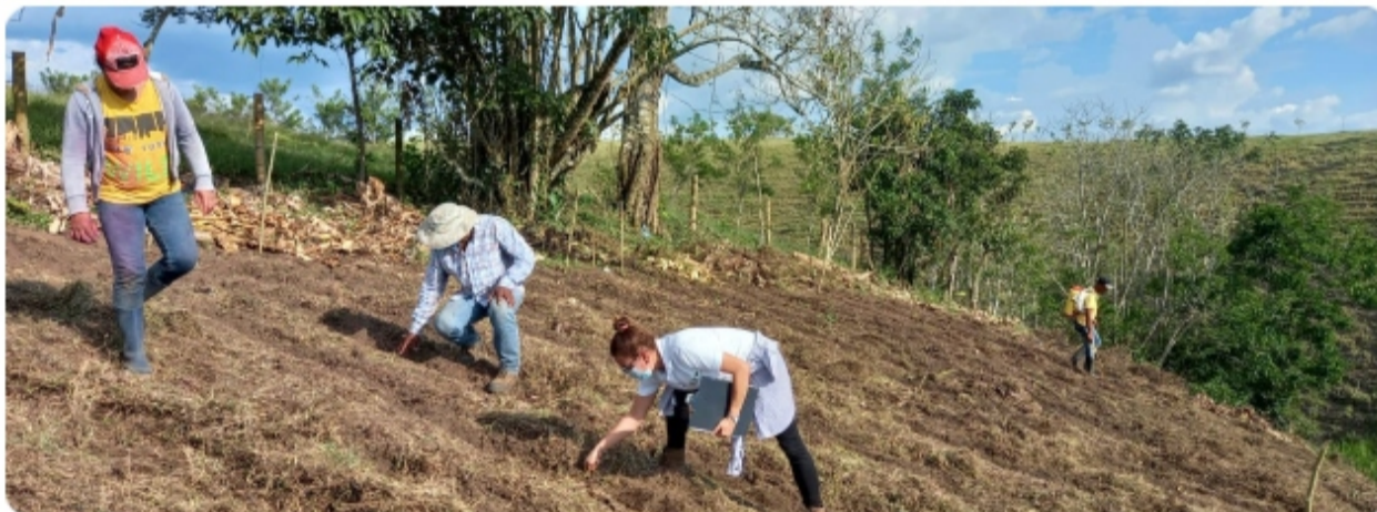
Pruebas de eficacia

Pereira, 26 de mayo del 2021. Funcionarios de la seccional del ICA en Risaralda verificaron el desarrollo de las pruebas de eficacia para la evaluación del inoculante biológico ACF SR en la producción de frijol, en el municipio de Alcalá, Valle del Cauca.