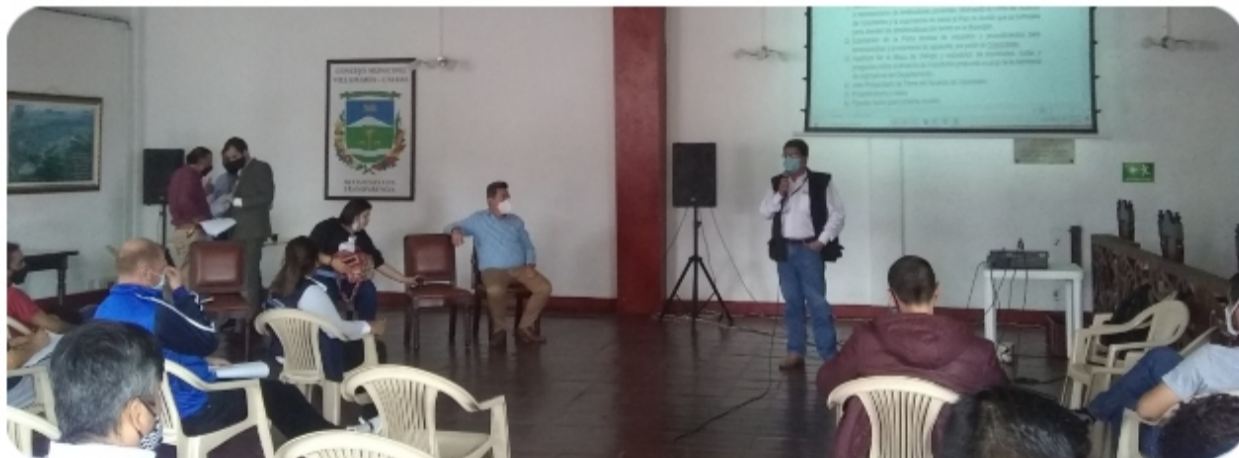
Mesa ambiental aguacate Hass