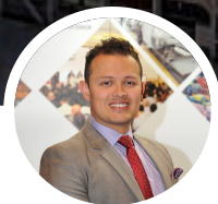
Autor: Juan Diego Cano Garcia Director de Asuntos Legales Analdex

El ocho de mayo entraron en vigencia los usuarios aduaneros de trámite simplificado, una nueva figura con tratamientos especiales en el comercio exterior. Conozca su origen, beneficios y algunas recomendaciones para adquirir y mantener la figura aduanera.