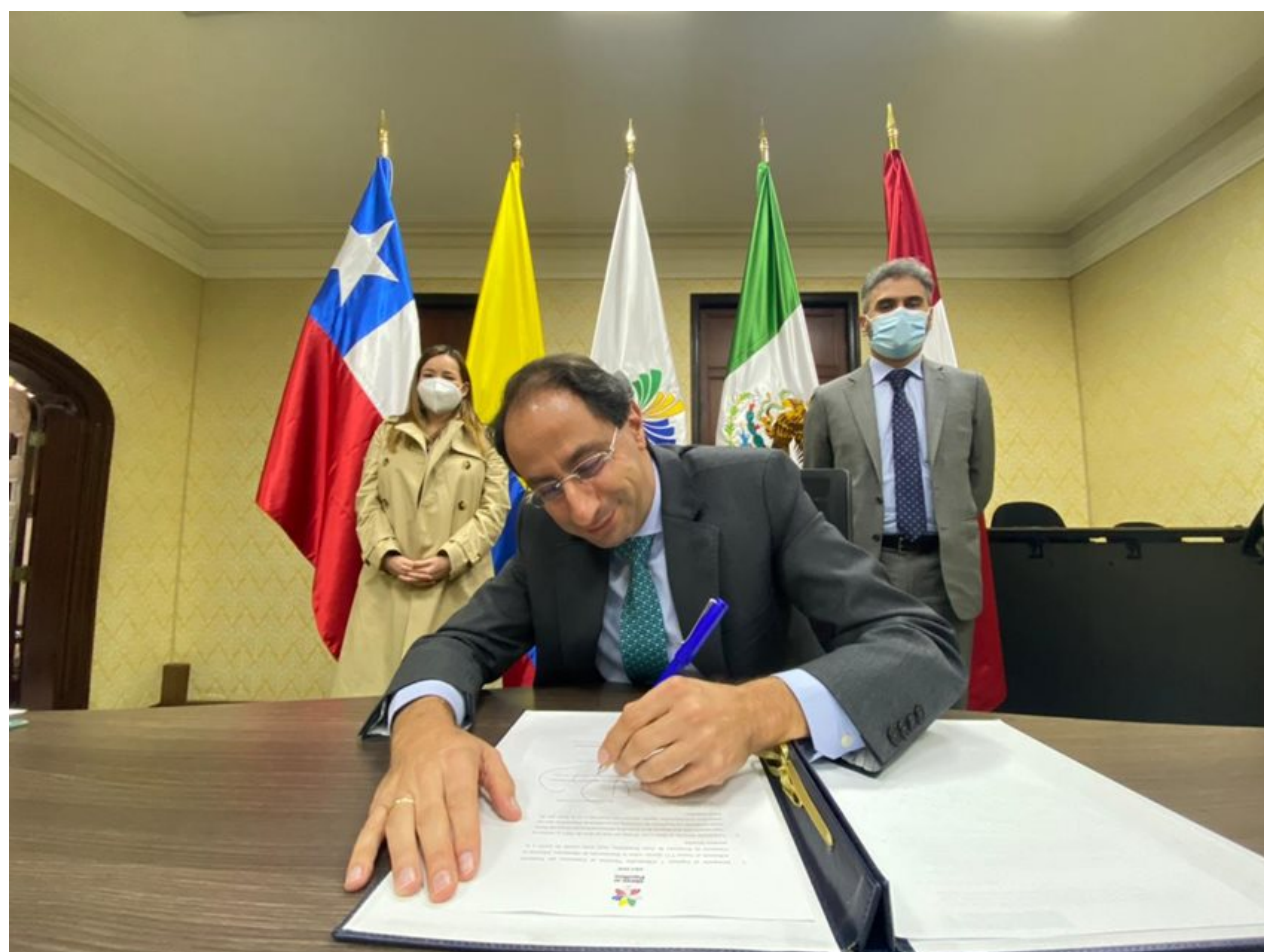
Pie de foto: los países también armonizaron los requisitos que deberán tener las etiquetas de los productos de aseo.

En 2020, Colombia exportó US$105 millones en esta clase de productos a los países de la Alianza del Pacífico.