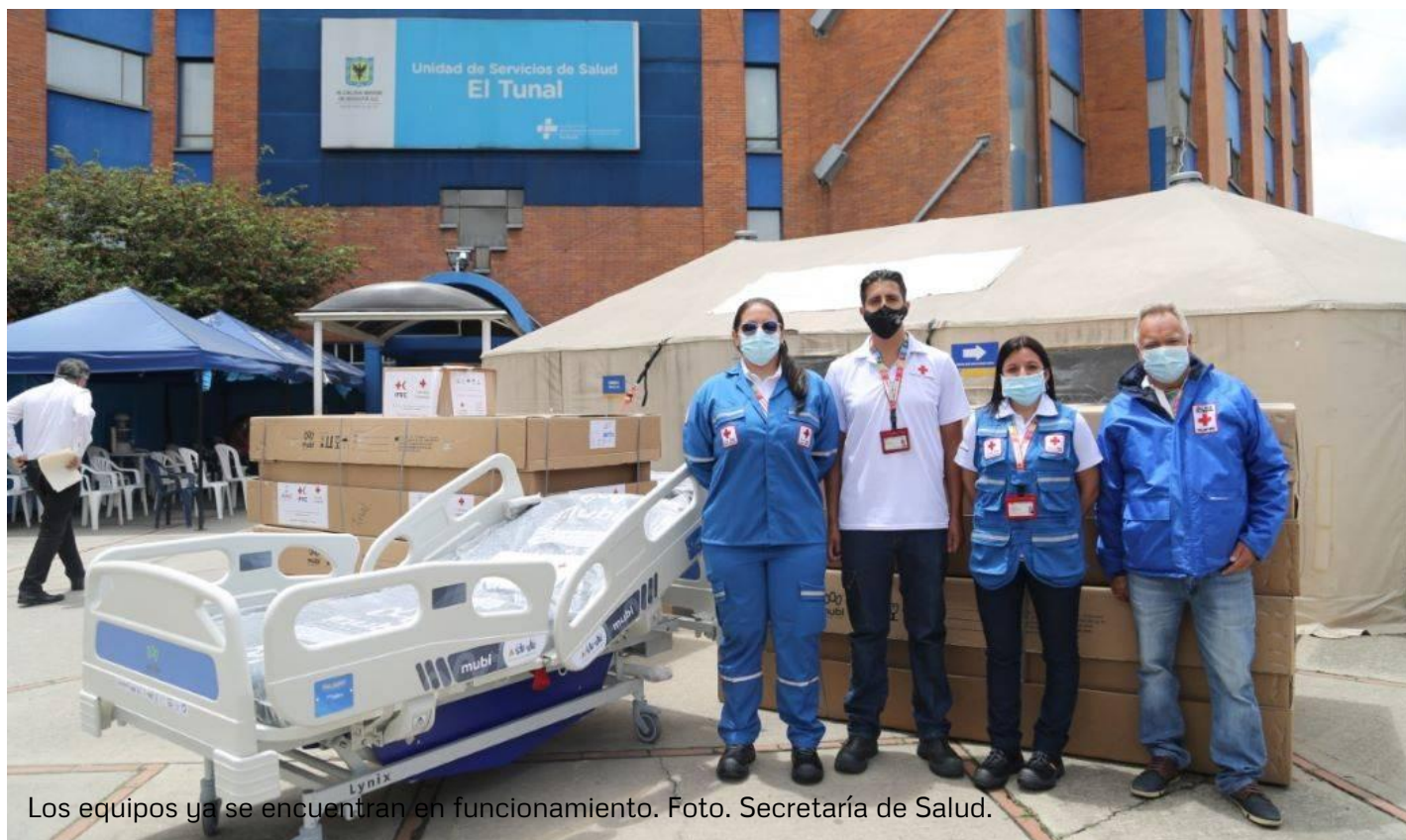
Los equipos ya se encuentran en funcionamiento.