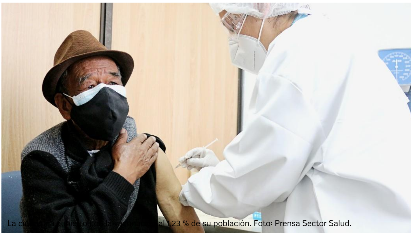
La ciudad ha cubierto con la vacuna el 1,23 % de su población.