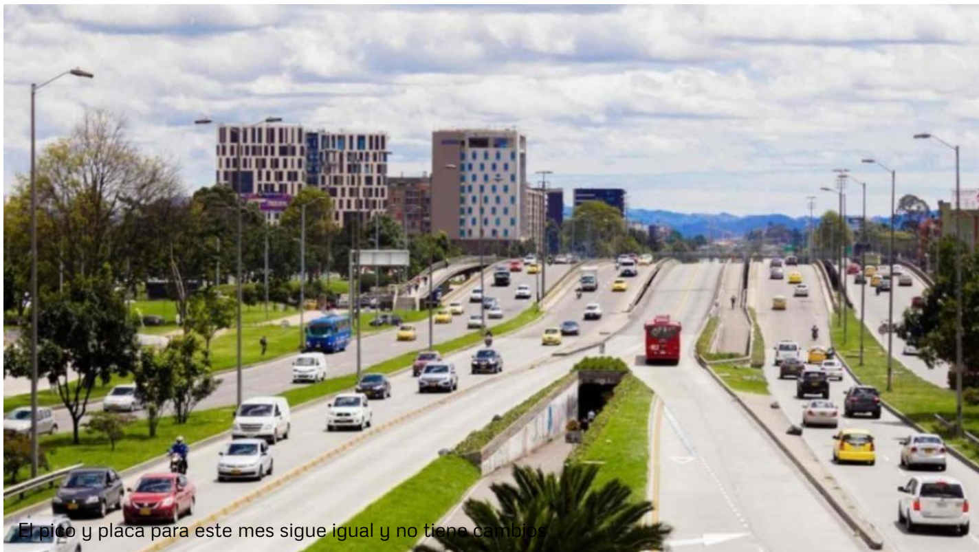
El pico y placa para este mes sigue igual y no tiene cambios