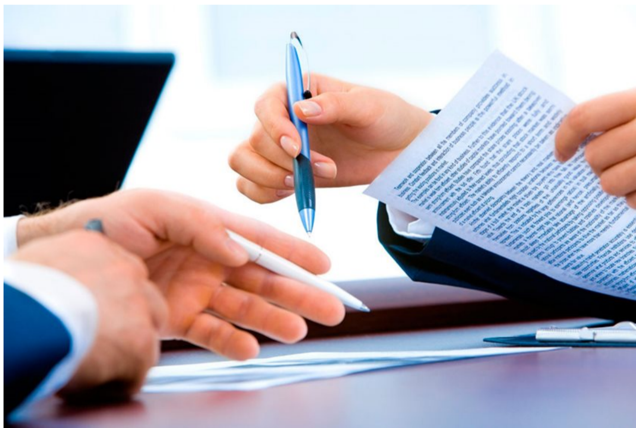
Pie de foto: La depuración normativa es otra herramienta de Estado Simple, Colombia Ágil.

Las propuestas entraron a un proceso de revisión por parte de un equipo de trabajo conformado por Mincomercio, sus viceministerios y la secretaria general. También hicieron parte del ejercicio las superintendencias de Sociedades y de Industria y Comercio.